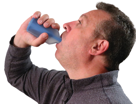
DIAGRAMA 2 - Uso previsto (sin funda aislante con fines ilustrativos)

Rx Only Precaución: La ley federal (EE. UU.) restringe la venta de este dispositivo por parte de un médico o por orden de un médico.